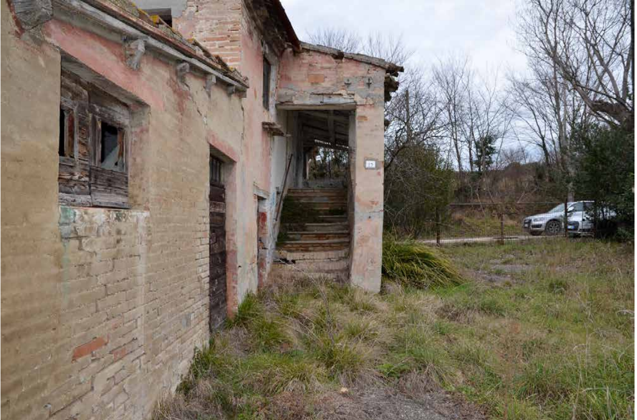
Vista della scala interna attraverso la quale si accede al primo piano.