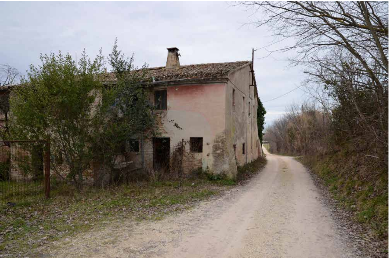
Prospetto Nord-Ovest - Vista della vegetazione infestante e del parziale crollo della copertura