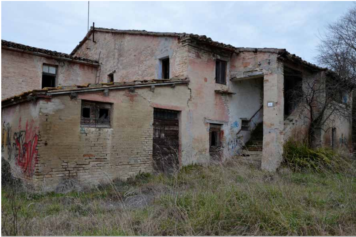
Prospetto Nord-Ovest - Vista del manto di copertura con evidenti crolli e della vegetazione parassita