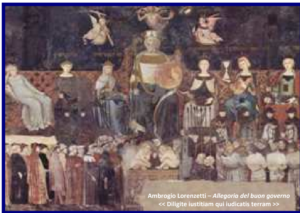
Ambrogio Lorenzetti – Allegoria del buon governo << Diligite iustitiam qui iudicatis terram >>